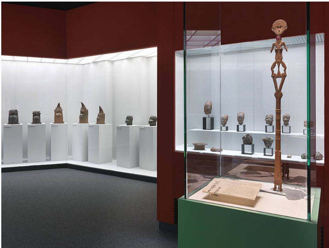
Installationsansicht „Springer: Surinam/Benin“