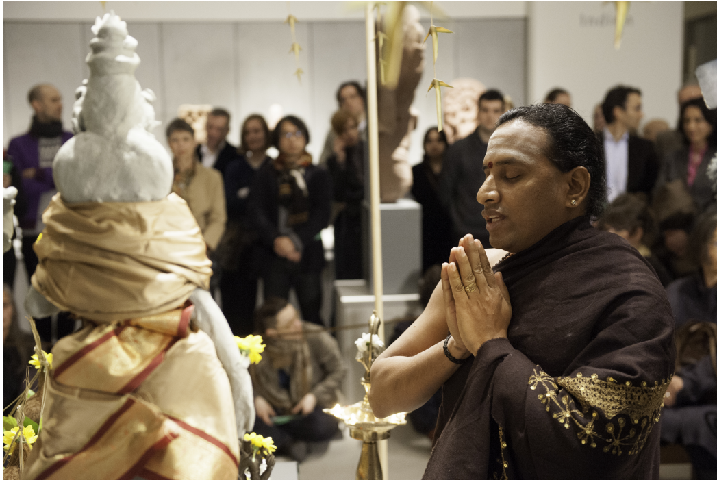
Purnakumbha-Ritual zur Eröffnung, durchgeführt vom Sri Mayurapathy Murugan-Tempel (Berlin Hindu Mahasabhai e. V.)