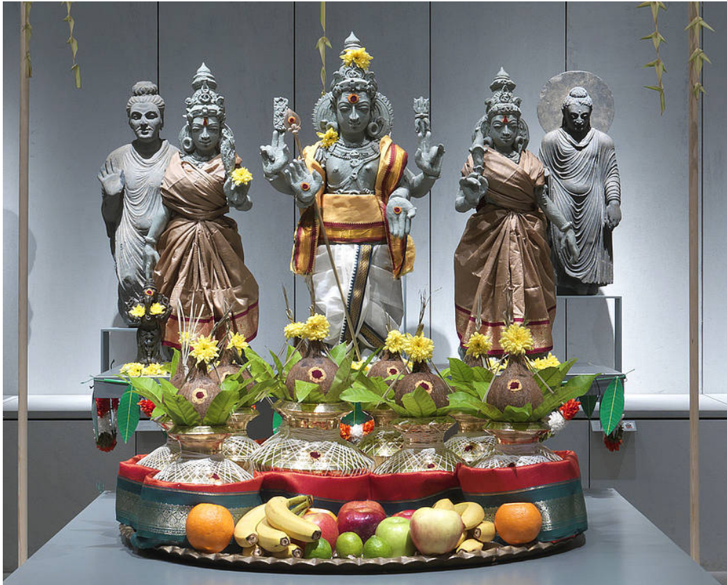
Installationsansicht „Springer: Purnakumbha“, Foto: Jens Ziehe

Hinweis für die PDF-Druckversion: alle Links sind auf den entsprechenden Unterseiten von www.humboldt-lab.de abrufbar.