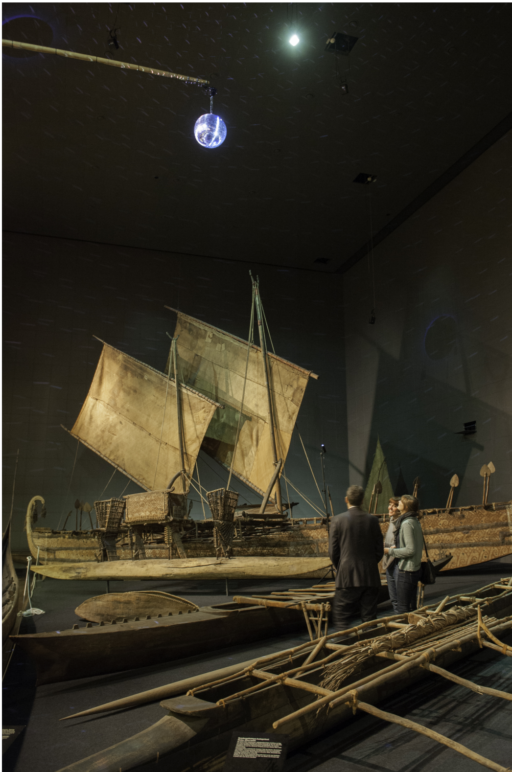
Installationsansicht „Springer: Spiegelkugel“