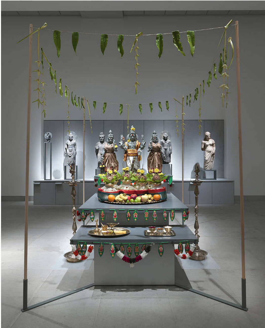
Installationsansicht „Springer: Purnakumbha“